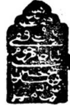
« صورة الصفحة الأخيرة من النسخة ك » « نسخة كربلاء »