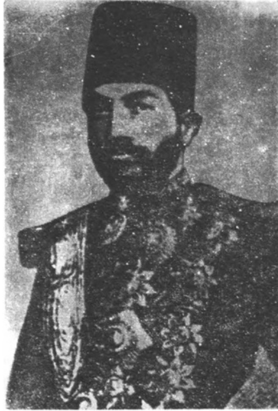
میرزا حسینخان سپہسالار اعظم