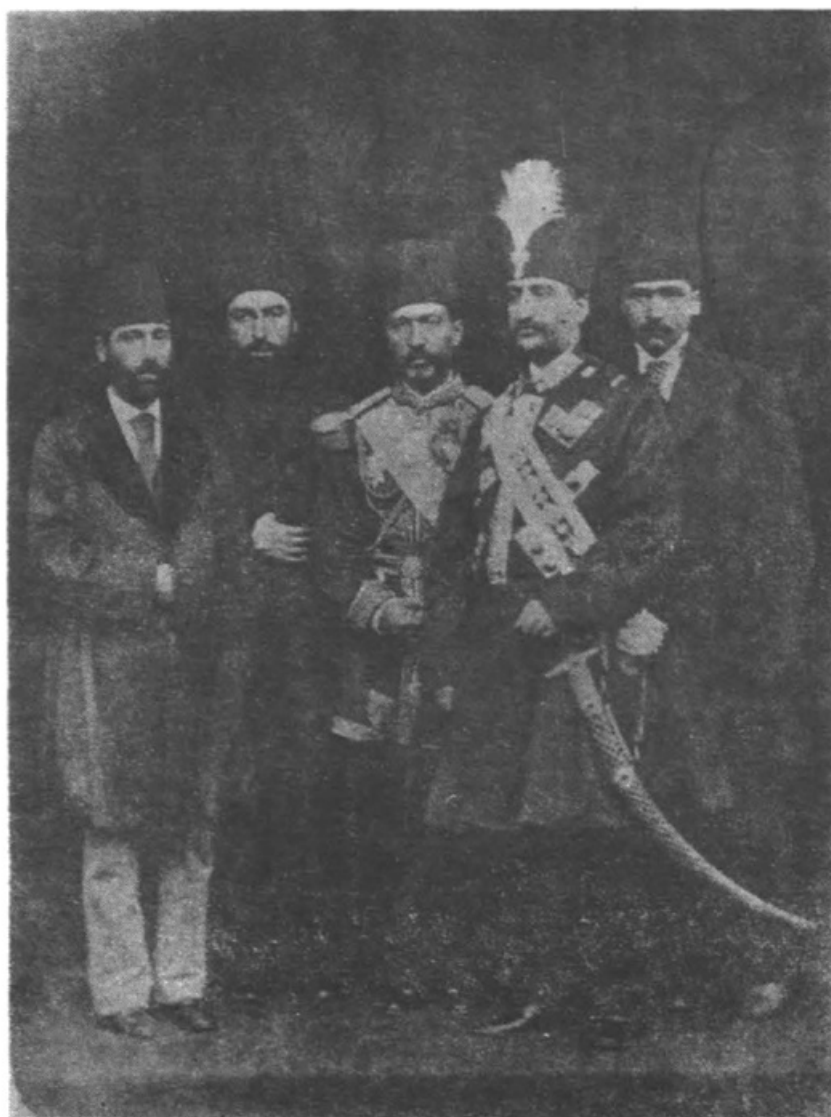
عکسی از سپهسالار و برادرانش، میرزا یحیی خان معتمد الملک (نفر اول سمت چپ) و میرزا نصرالله خان نصر الملک (نفر دوم سمت چپ) و میرزا عبدالله خان علاء الملک (نفر اول سمت راست) در آخرین سال اقتدار او در حضور ناصرالدین شاه

عکسی از سپهسالار و برادرانش، میرزا یحیی خان معتمد الملک (نفر اول سمت چپ) و میرزا خان نصر الملک (نفر دوم سمت چپ) و میرزا عبدالله خان علاء الملک (نفر اول سمت راست) در آخرین سال اقتدار او در حضور ناصرالدین شاه