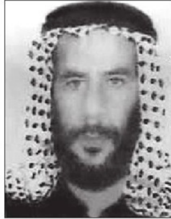
↑ تصویر احمد الحسن البصری