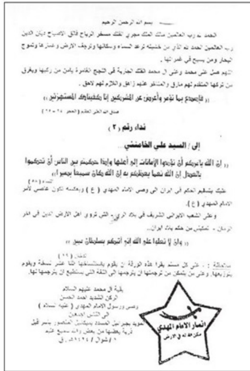
↑ تصوير نامه تحويل حكومت به مقام معظم رهبری