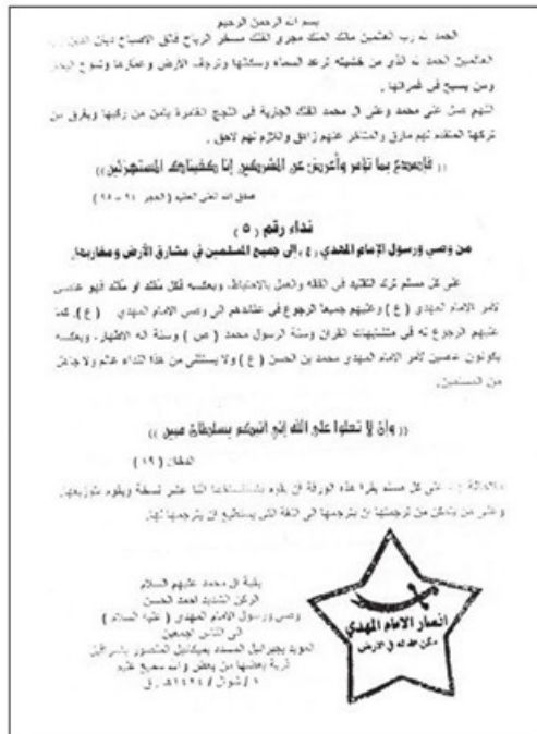
↑ تصوير بيانيه دستور ترك تقليد