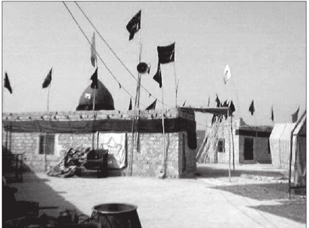
↑ تصویر اولین محل تبلیغ احمدالحسن البصری در صریفه