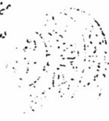
صورة الصفحة الأخيرة من نسخة الأصل

وسلام ومحبته وكنت مولها الأثر عبد الرحمن عاشقها عليها