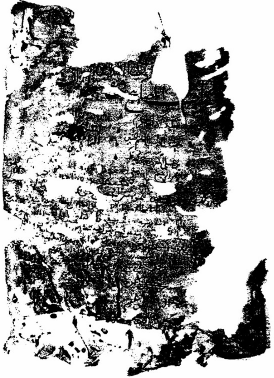
صورة الصفحة الأولى من النسخة (ج)

تفسير الوزير المغربي (المصابيح في تفسير القرآن) ..... ٣٥٩