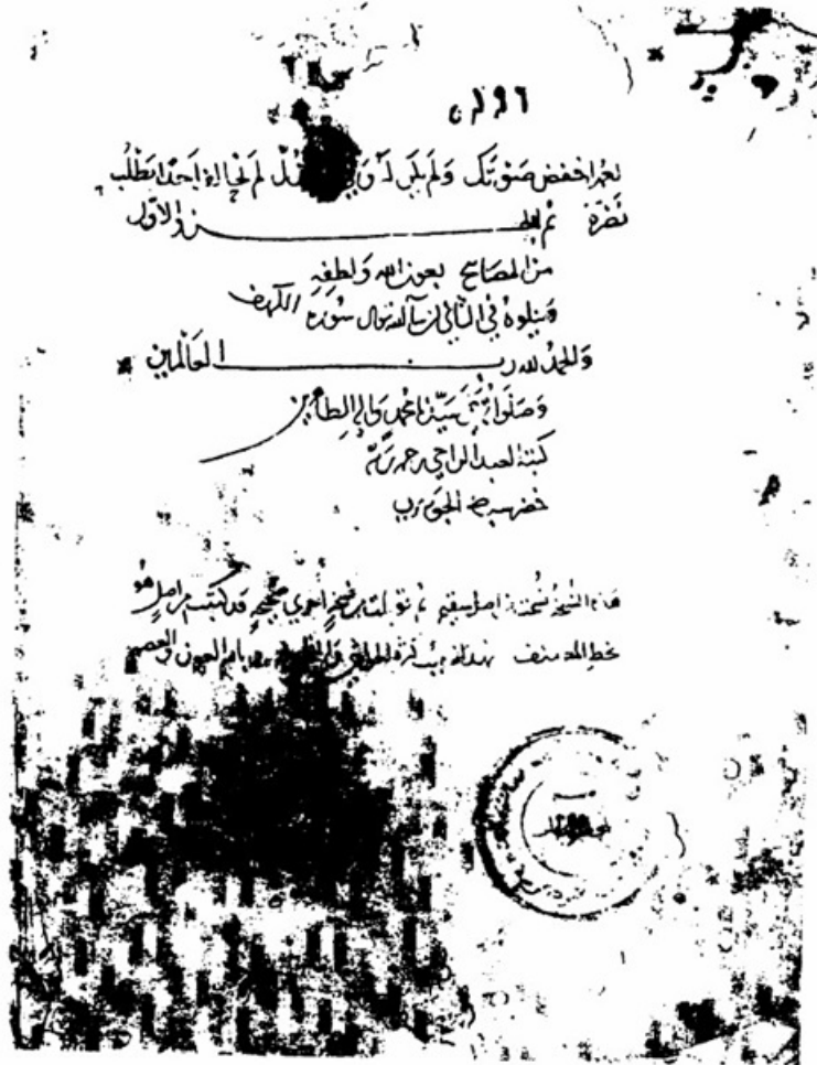
صورة الصفحة الأخيرة من النسخة (أ)