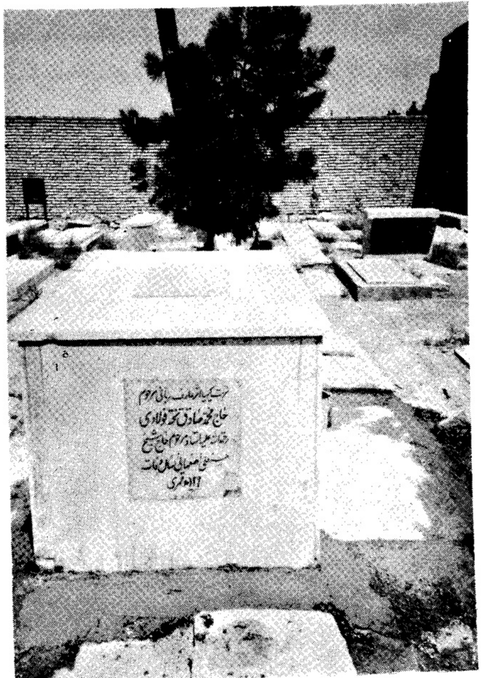
مزار مرحوم حاج محمد صادق تخت فولادی