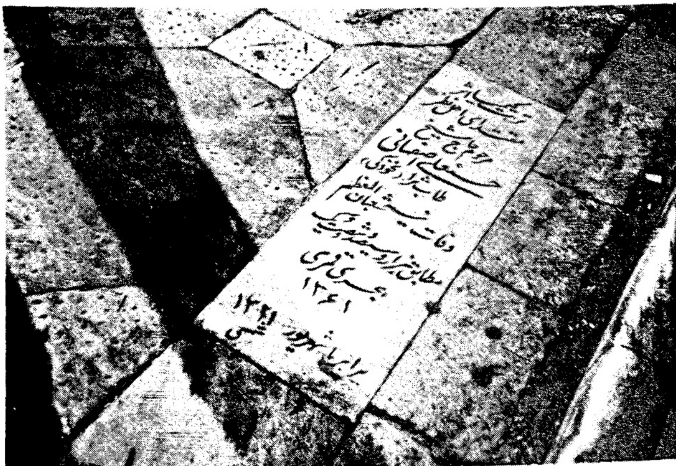
مزار مرحوم شیخ حسنعلی اصفهانی