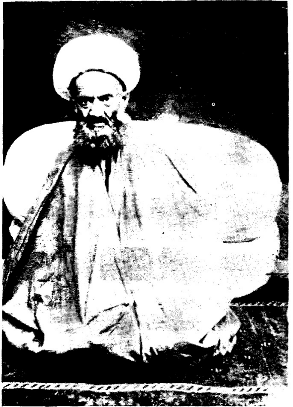
تمثال عارف ربانی مرحوم حاج شیخ حسنعلی اصفهانی قده سره