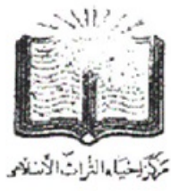
مركز بحوث التراث الأندلسي

يوم الثلاثاء التاسع من شهر ربيع الأول سنة ١٢٥٠