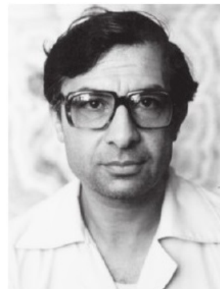
جلال‌الدین فارسی درباره پذیرفتن نخست‌وزیری: مسئله از نظر من متغی شده است به این علت که خط من با خط ایشان (بنی‌صدر) تفاوت دارد، همین باعث می‌شود نتوانیم همکاری کنیم

امروز مجلس شورای اسلامی، به گونه ای بی سابقه، یکی از شلوغ ترین و متشنج ترین جلسات خود را پشت سر گذاشت. جو مجلس آن چنان غیرعادی بود که هم از طرف وکلای مجلس و هم از طرف تماشاچی ها بارها به تشنج کشیده شد. جلسه امروز مجلس شورای اسلامی به ریاست حجت الاسلام هاشمی رفسنجانی تشکیل شد و ۳ ساعت و ۱۰ دقیقه به طول انجامید و در آن اعتبارنامه حسن آیت با ۱۱۴ رأی موافق و ۳۰ رأی مخالف و ۲۶ رأی ممتنع به تصویب رسید. (۲)