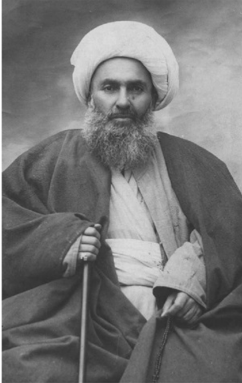
شیخ فضل الله نوری