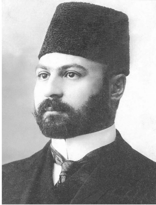
میرزا حسن خان پورنیا (مشیرالدوله)