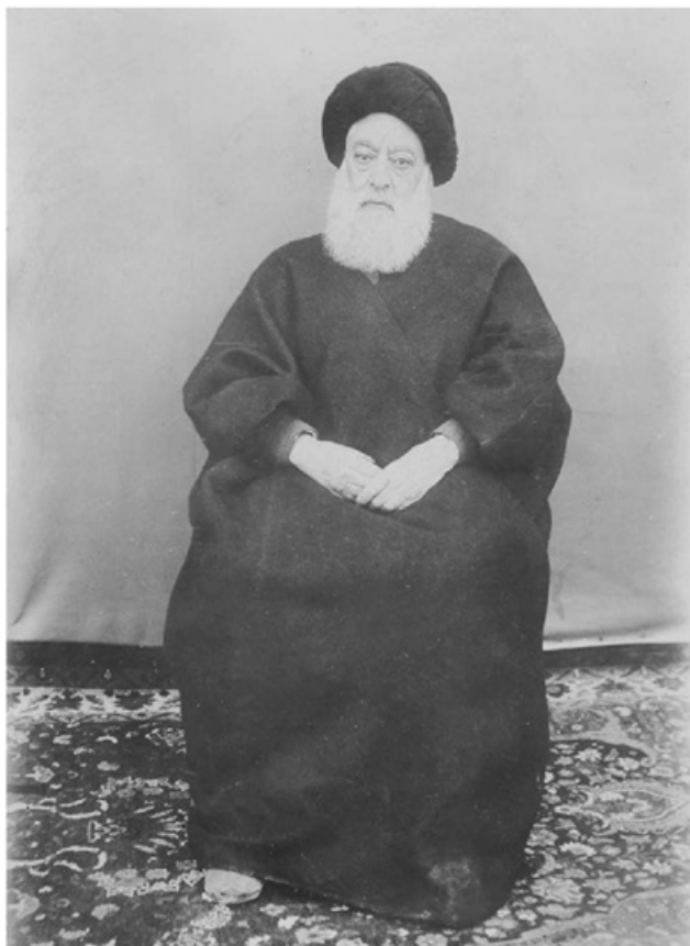
آیت‌الله سید محمد طباطبائی