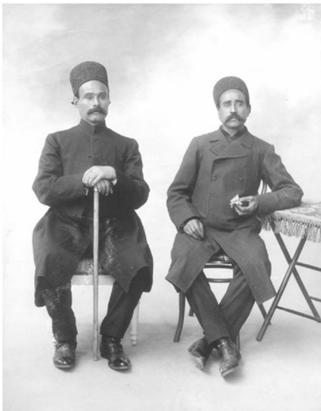
ستارخان و باقرخان، سردار ملی و سالار ملی