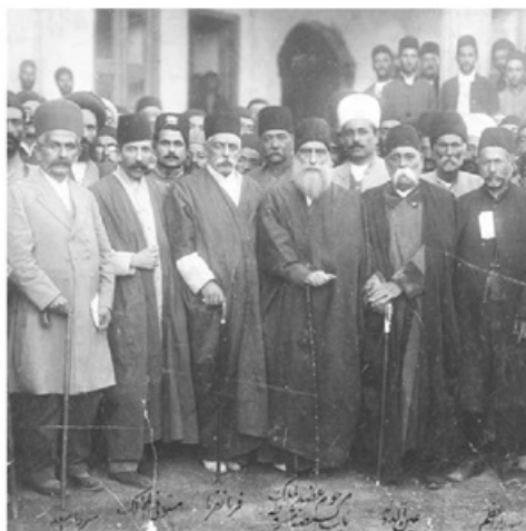
سپهبدار اعظم، عین الدوله، عضدالملک، فرمانفرما، مستوفی الممالک، سردار اسعد