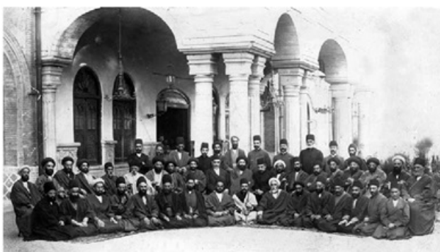
نمایندگان دوره اول مجلس شورای ملی