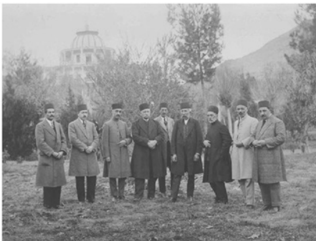
نفر چهارم از سمت راست: مستوفی الممالک