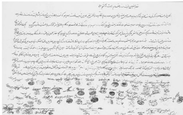
اعتراض به پایمال شدن قوانین اسلام پس از مشروطیت