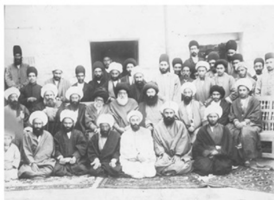
شیخ فضل الله نوری و آیت الله سید محمد طباطبایی در بین علمای تهران