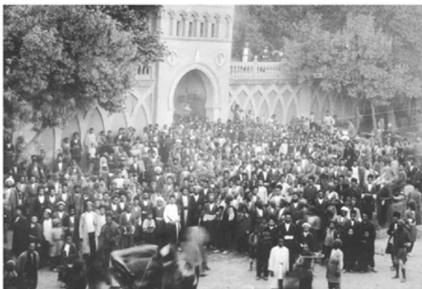
تجمع مردم در جلوی سفارت انگلیس در حمایت از مشروطیت