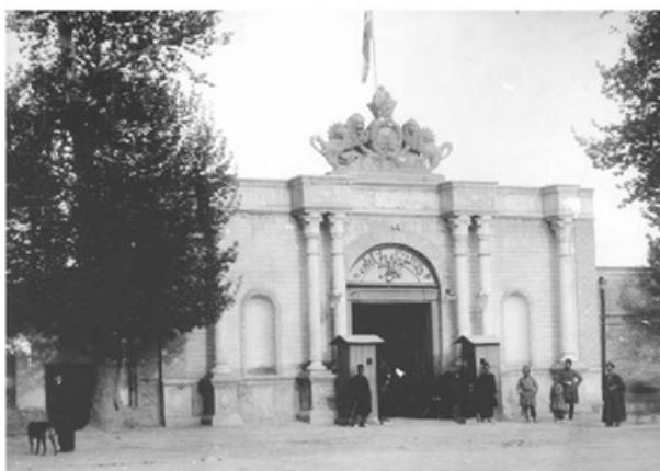
سر در مجلس شورای ملی