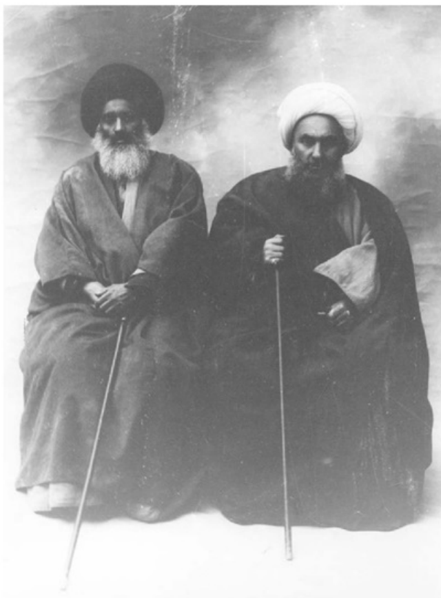
شیخ فضل الله نوری و آیت الله سید عبدالله بهبهانی