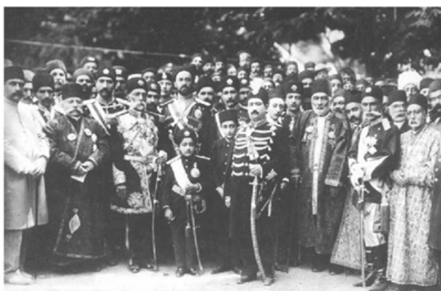
محمدعلی شاه به همراه احمد میرزا ولیعهد و لیاخوف روسی و جمعی از درباریان در باغشاه