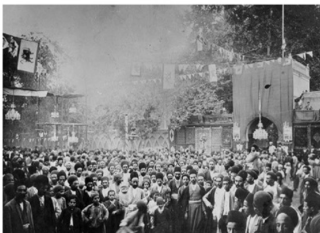
جشن و چراغانی به مناسبت پایان تحصن و فرمان مشروطه جلوی سفارت انگلیس