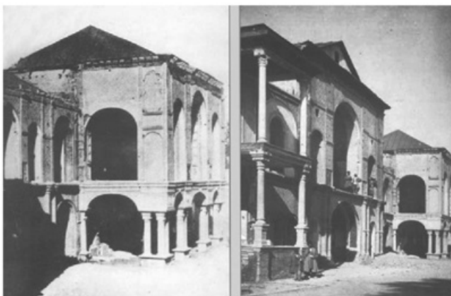
ساختمان مجلس پس از به توپ بسته شدن