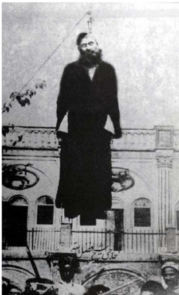
شیخ فضل الله توری بر فراز چویه دار