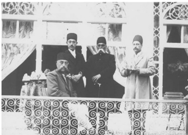
لحظه توشیح فرمان مشروطیت توسط مظفرالدین شاه با حضور عین الدوله