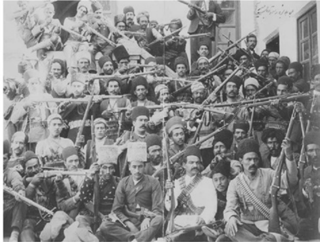
دسته‌ای از مجاهدین مشروطه