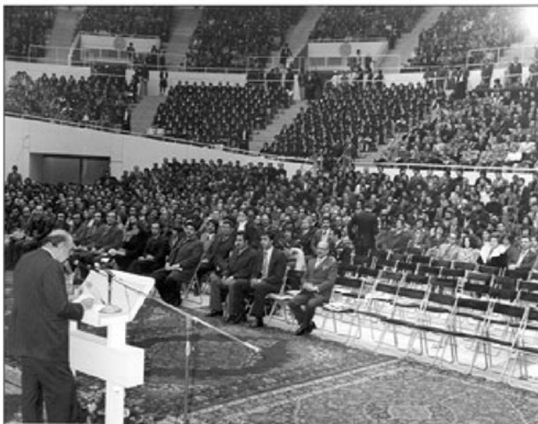
کنگره حزب ایران نوین