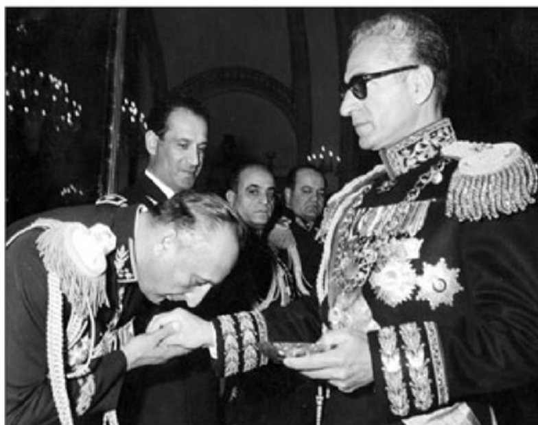
سپهبد نعمتالله نصیری و شاه