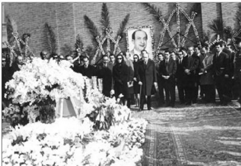
هویدا و دیگر کبار تو فریاده امینی بر مزار منصور