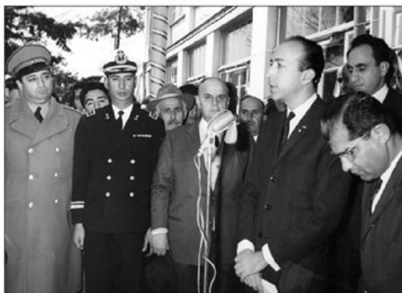
جوان منصور در حال سخنرانی