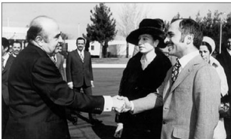
ملک حسین پادشاه آرمن و همسرش - هویده