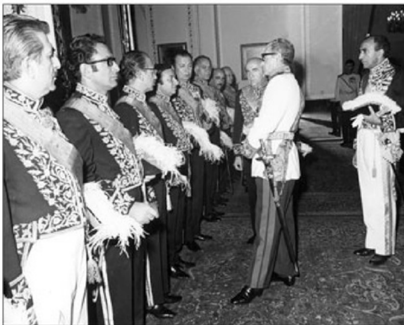
النساری نمر روبروی شاه

نمر حنوم از سمت راست هنری کیسینجر - جروالد فورد رئیس جمهور وقت آمریکا - النساری - اردشیر زاغدی