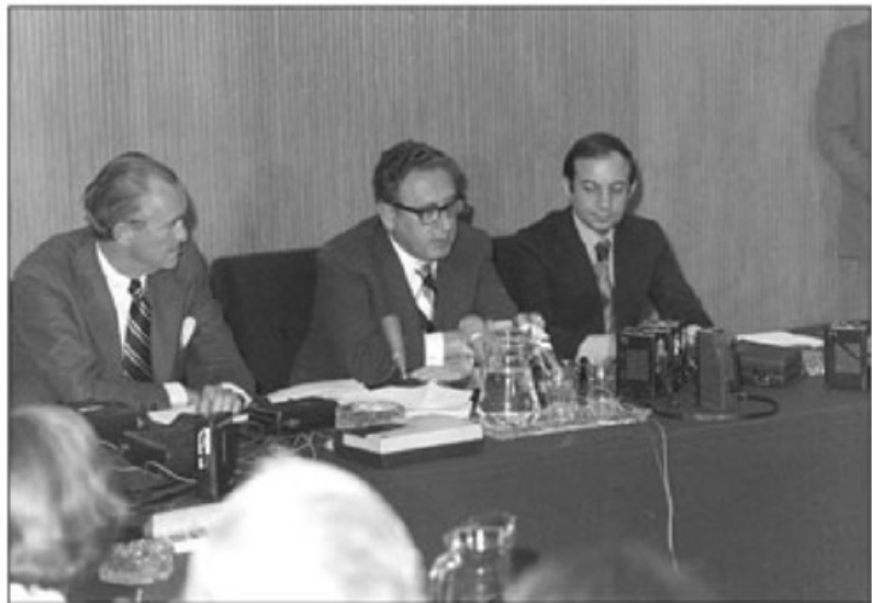
انصاری - ہیری کیسینجر