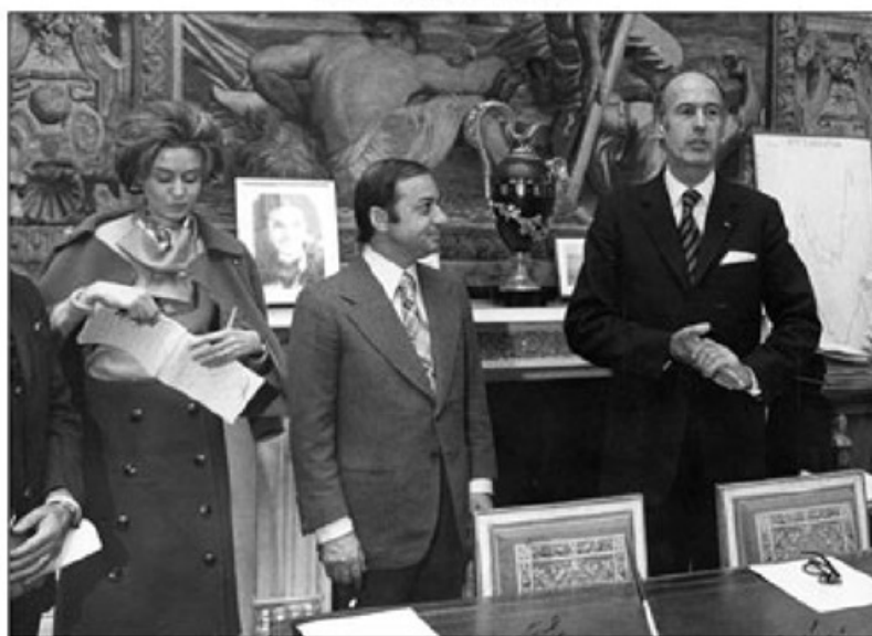
ژنرال دستان رئیس جمهور فرانسه - نصاری