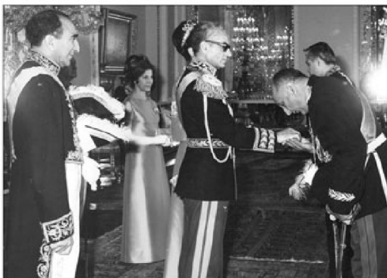
سپهبد نصیری و شاه - نفر اول سمت چپ آصفالله علم