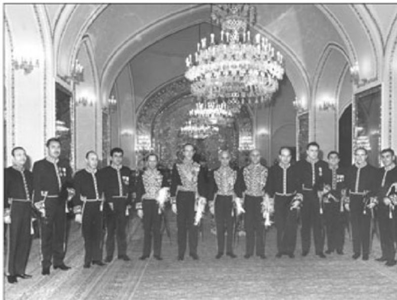
نظر ششم از سمت چپ جوان منصور