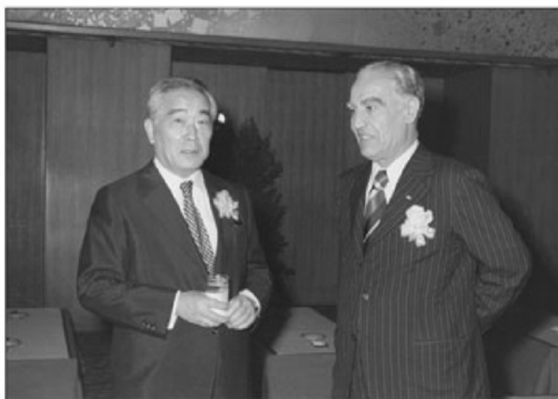
منوچهر کمال و نخست وزیر ژاپن