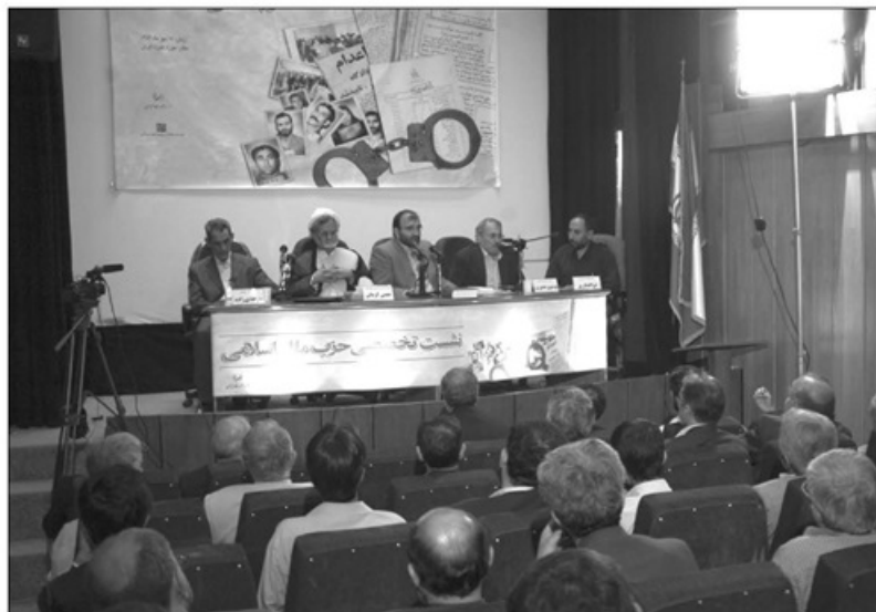
نشست تخصصی حزب ملل اسلامی