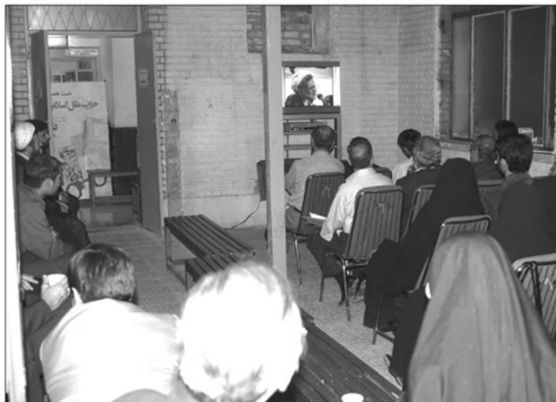
موزه عبرت ایران