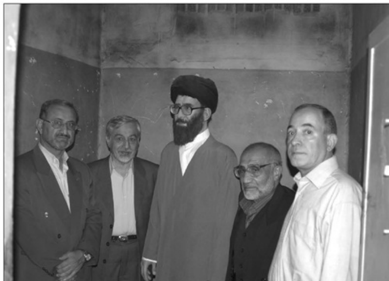
غرفه‌های مختلف موزه عبرت ایران