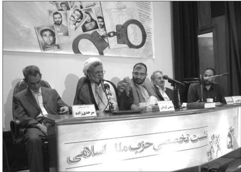
نشست تخصصی حزب ملل اسلامی