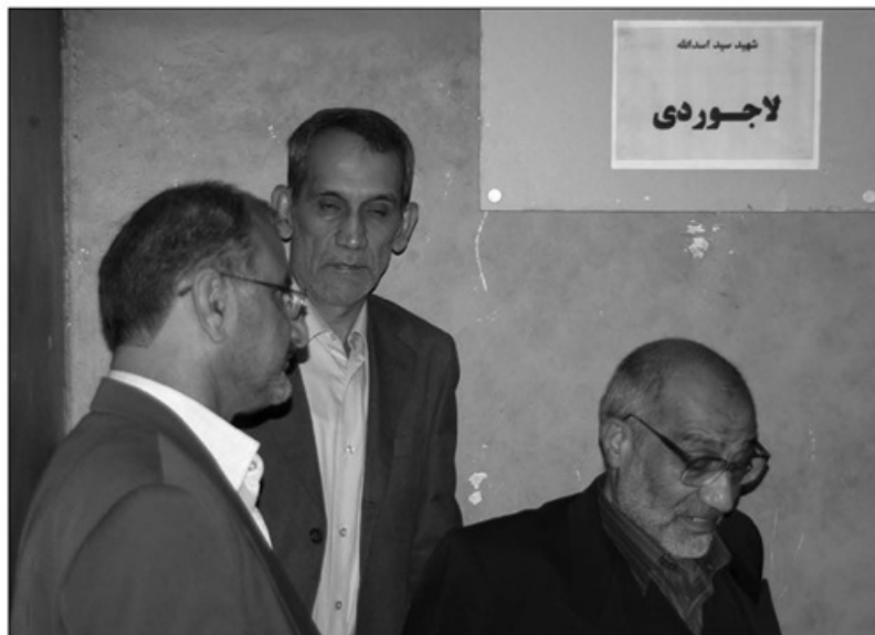
بازدید اعضای حزب ملی اسلامی و مدعوین نشست تخصصی از موزه عبرت ایران