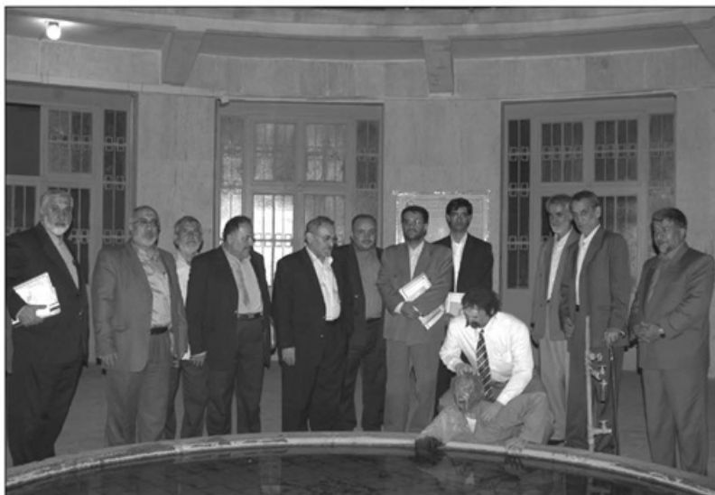
اعضای حزب ملل اسلامی و شرکت کنندگان نشست تخصصی در محل موزه عبرت ایران