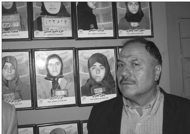
موزه عبرت ایران