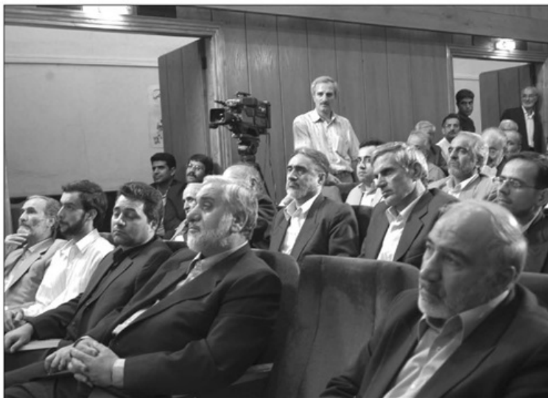
سالن اجتماعات موزه عبرت ایران