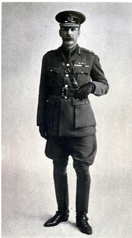
انگلیسی‌ها در اگوست ۱۹۱۶ نیروهای بیشتری روانهٔ خوزستان کردند: «اهمیت اقدام برای تضمین جریان نفت، که درباری مدام بر آن تأکید داشت، به دلیل نیاز قوای اعزامی به سوخت، به مراتب بیشتر هم شده بود.» در اواخر اکتبر ۱۹۱۶، ژنرال ماورد از چاه‌های نفت بازدید کرد و «ترتیباتی برای تقویت تدابیر دفاعی از آن چاه‌ها انجام داد. (صفحه ۱۴۳)