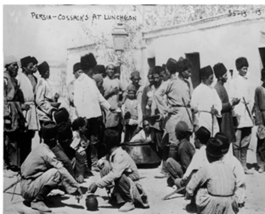
قزاق‌ها در حال خوردن ناهار کالدول در گزارشی به تاریخ ۲۲ اگوست ۱۹۱۵ می‌نویسد: «هزار و هفتصد قزاق روس که ۹۰ روز در قزوین مستقر بودند، پیش‌روی خود را به سوی تهران آغاز کردند». (صفحه ۱۵۰)