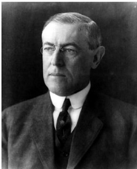
رئیس‌جمهور آمریکا وودرو ویلسن