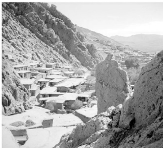
در ۱۲ مارس ۱۹۱۶، ژنرال بارتوف، کرند را اشغال کرده بود و حالا تهدیدی برای نیروهای ترک در دجله به حساب می‌آمد. (صفحه ۱۷۹)