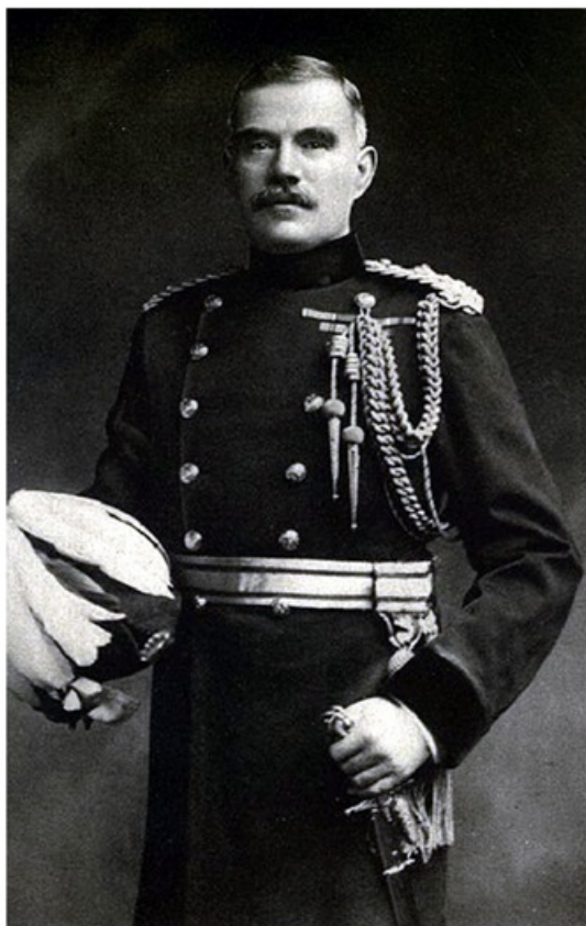
سر ویلیام رابرتسن، رئیس ستاد کل پادشاهی بریتانیا