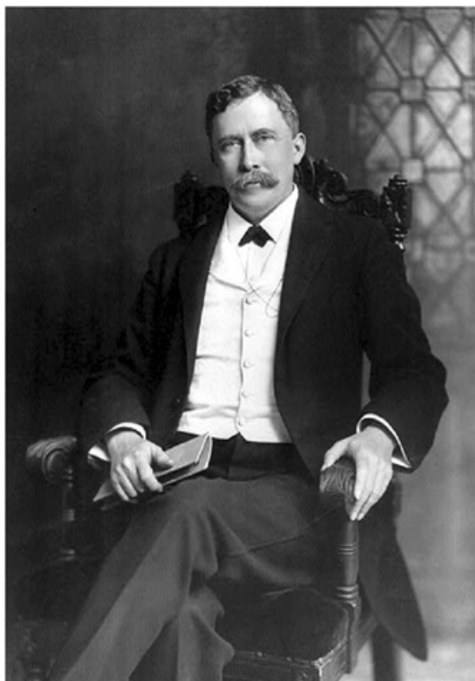
چارلز ولز راسل: «همین چند وقت پیش از یک ناظر خارجی، که تقریباً دو سال را در ایران گذرانده، شنیدم که ایران در بهترین شرایطی است که او در طول مدت اقامتش در این کشور شاهد بوده است. (صفحه ۳۱)»