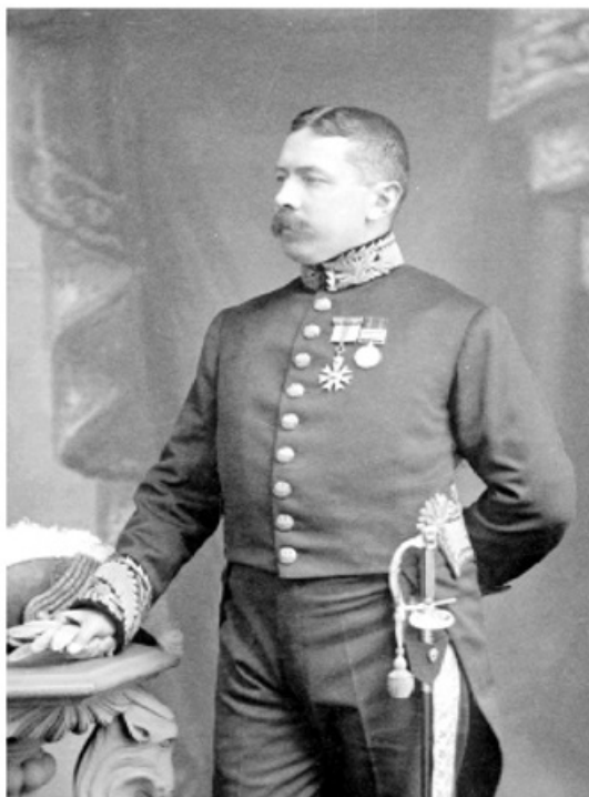
اهمیت وافر نظرات سایکس به سبب آن است که نمونه خوبی از تحریف‌های شایع و تصاویر غلطی ارائه می‌دهد که درباره ایران در سنت تاریخ‌نگاری انگلیس وجود دارد. (صفحه ۱۶۵)