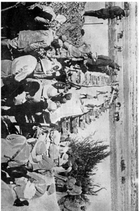
در پاییز ۱۹۱۵، نیروی امپراتوری انگلیس بر سواحل خلیج فارس تسلط یافت و بازرگانی نزدیک به ۴۰۰ کیلومتر در طول رود فرات و ۵۰۰ کیلومتر در طول رود دجله را به تصرف خود درآورد. (صفحه ۱۶۱ و ۱۶۲)