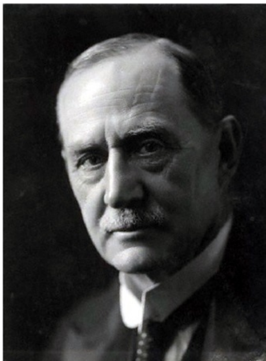
هر چند انگلیسی‌ها دولت ایران را از اعزام نیروهایی به فرماندهی ژنرال دنسترویل به خاک این کشور مطلع ساخته بودند، هرگز جویای نظر مساعد دولت ایران در این باره نبودند. (صفحه ۴۰۰)