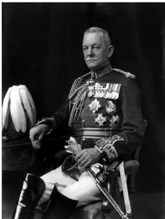
سپهبد سر ای. بی. بُرت ژنرال بُرت تصمیم گرفت یک گردان پیاده‌نظام هندی (گردان هفتم راجپوتس) را از قریه به اهواز بفرستد. «... ژنرال بُرت با وزارت امور هند هم عقیده بود که تأثیر روحی اشغال اهواز توسط ترک‌ها و حمله آنها به چاه‌های نفت بسیار جدی است.» انگلیسی‌ها بلافاصله محمره را اشغال کردند. بی‌اعتنا به بی‌طرفی ایران. (صفحه ۱۰۱)