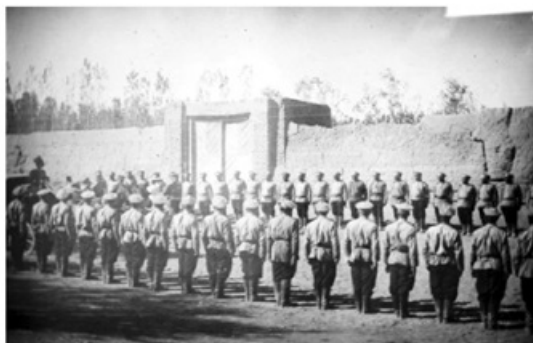
نیروهای روس در ایران