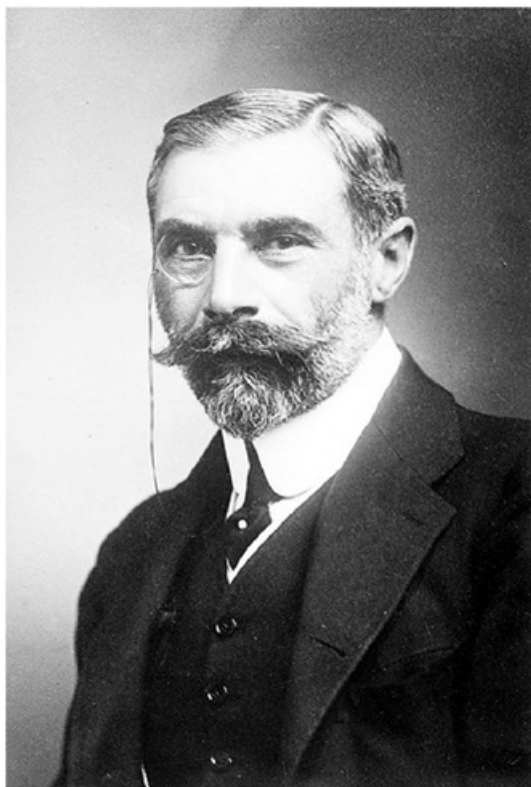
سر چارلز مارلینگ انتصاب مارلینگ به وزیرمختاری انگلیس نتیجه توافق پنهانی انگلیس و روس برای تقسیم مجدد ایران بود. (صفحه ۱۰۴)