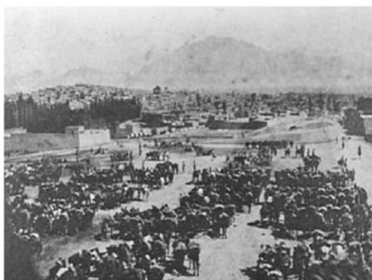
در ۲۵ همان ماه روس‌ها خبر دادند که ژنرال باراتوف روس که به سوی کرمانشاه می‌روی می‌کرد در واقع توانسته بود این شهر را تصرف کند. (صفحه ۱۷۸)