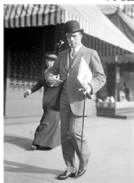
شوستر می‌گوید که «وثوق‌الدوله بیشتر از همه بر پذیرش خواست روسیه برای اخراجش اصرار می‌ورزید». (صفحه ۳۰۸)