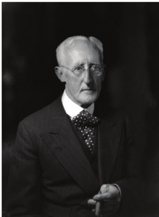
سر پرسی کاکس، که کمیسیونر غیرنظامی دولت اعلیحضرت پادشاه بریتانیا در بین‌النهرین بوده است... انتصاب وی به جای سر چارلز نشان می‌دهد که حالا که انگلیسی‌ها، حتی اگر چنانکه ایرانی‌ها می‌گویند «بی‌رحمانه» به کنترل سیاسی ایران دست یافته‌اند، تلاش خواهند کرد تا از ایرانی‌ها دلجویی کنند و حسن‌نیت آنها را نسبت به انگلیس و سلطه سیاسی و اشغال نظامی ایران به دست آورند. (صفحه ۴۹۸)