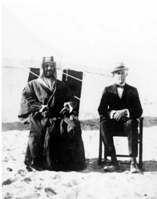
وزیرمختار انگلیس، سر پرسى كاكس و عبدالعزیز بن سعود پیش‌بینی می‌شود که ژنرال سر پرسى كاكس در حدود ۱۵ سپتامبر وارد اینجا شود. او چند ماهی برای مشاوره با دولت انگلیس در لندن به سر برده است. می‌گویند آدم بسیار پراترزی و محکمی است و این سفارت به طور محرمانه اطلاع یافته است که او مجدانه سیاستی را دنبال خواهد کرد تا ایران را مجبور سازد به طرفداری از متفقین وارد جنگ شود. (صفحه ۴۷۵)