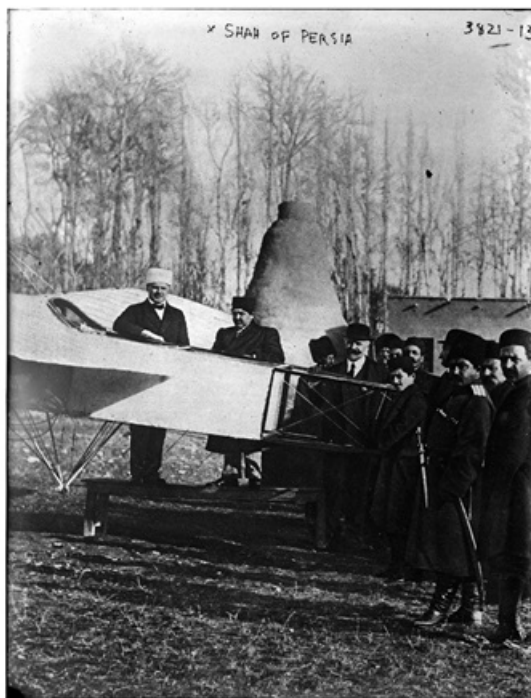
کالدول در ۴ اگوست از فشارهای انگلیس بر احمدشاه خیر داد: «شنیده‌ام که شاه تحت فشار انگلیس، از دولت ایران خواسته است تا استعفاء بدهد، ولی دولت تن به استعفاء نمی‌دهد. (صفحه ۴۹۴)