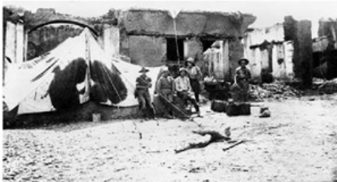
در ژانویه ۱۹۱۸ «برای محافظت از جاده خانقین به کرند، [مارشال] پیشنهاد کرد که یگانی از نیروهای انگلیسی قصر شیرین را به تصرف خود درآورند.» این اولین گام انگلیسی‌ها برای اشغال نیمه شمالی ایران بود که قوای روس چندی قبل تخلیه‌اش کرده بودند. (صفحه ۲۳۴)