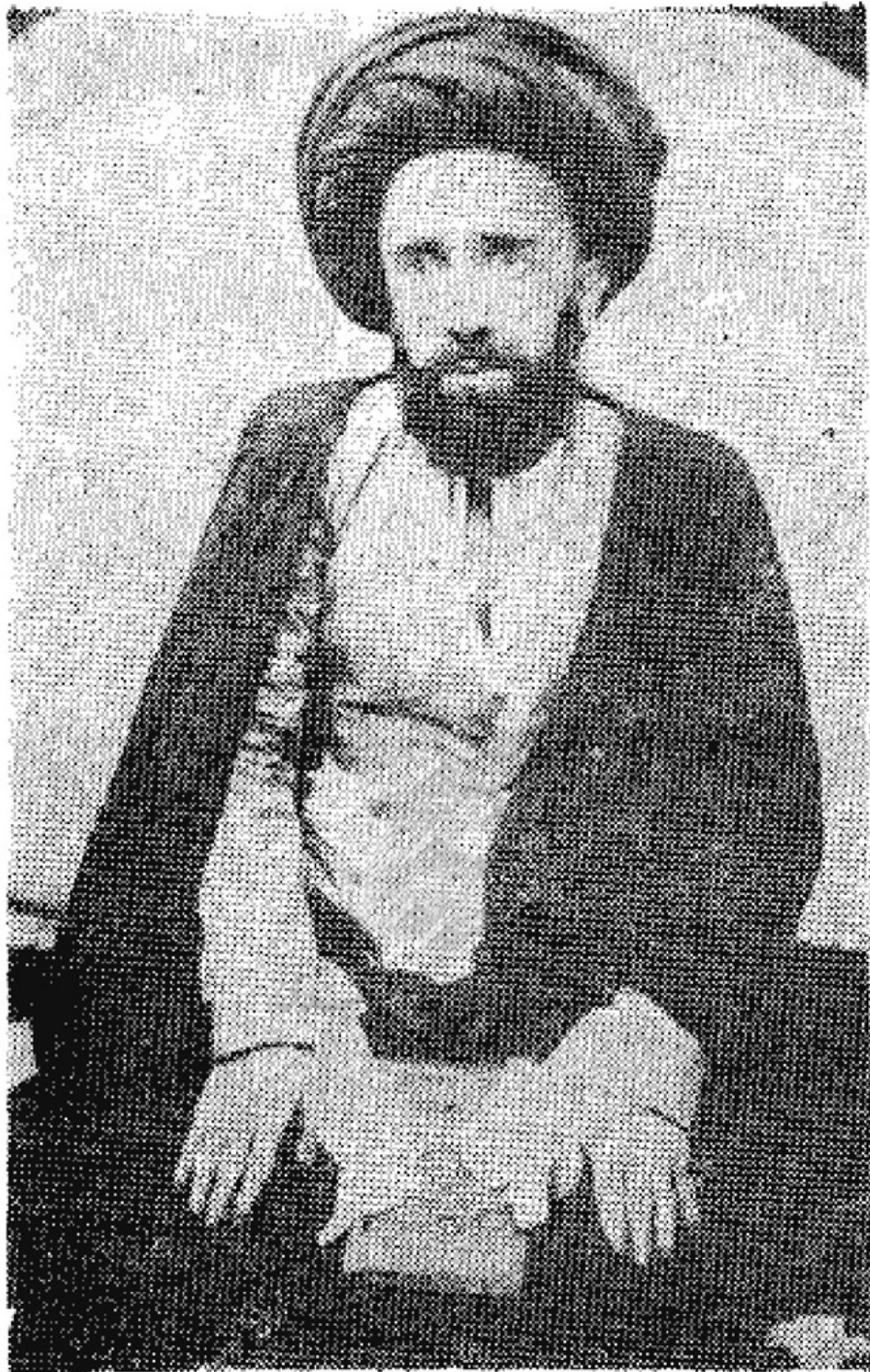
آیت الله حاج سید محمد باقر شفتی

98 یکم معارف الرجال) و در فقه و اصول و کلام صاحب نظر گردیده و از علماء مورد توجه گردیده خانه او مجمع علماء و ادباء و شعراء گردیده و خود بفارسی و عربی در نهایت خوبی و روانی شعر میسروده و با جمعی از ادباء زمان همچون سید جعفر حلی و دیگران در مجلس انس خود مقطعاتی میسروده اند.