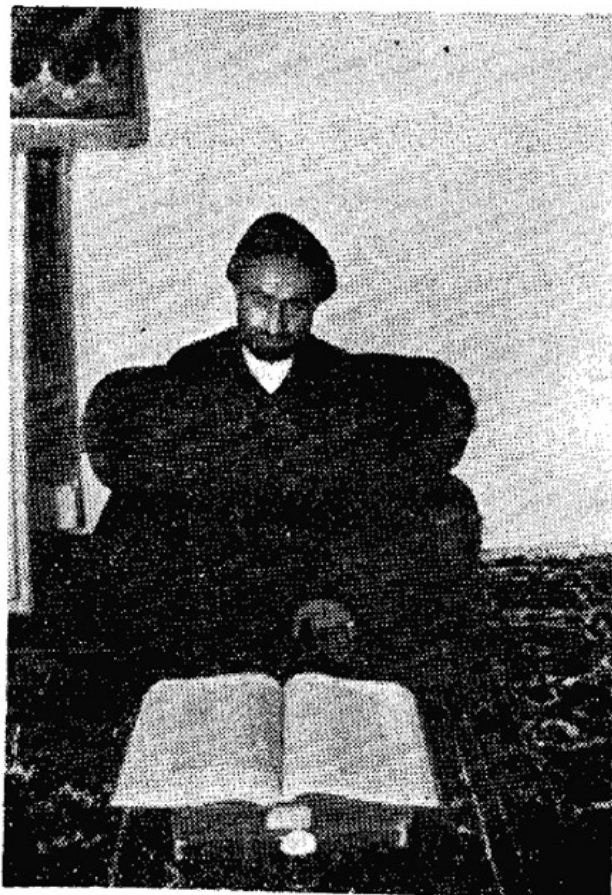
حجة الاسلام سيد محمد جواد شفتی