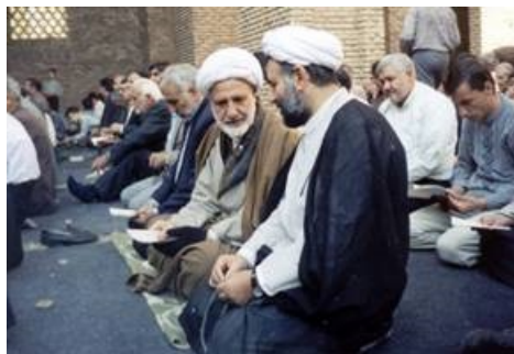
عکس شماره دو