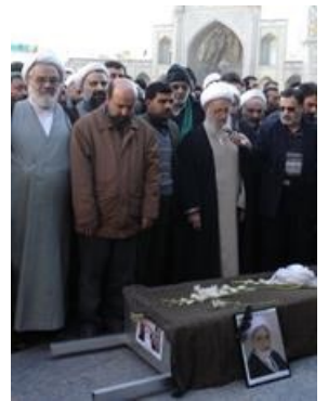
عكس شماره چهار