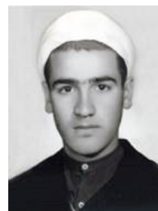
عکس شماره دو