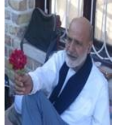
عكس شماره يك