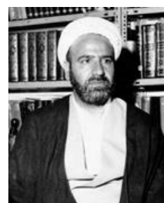
عکس شماره سه