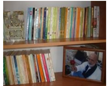
عكس شماره سه