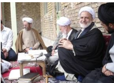
عکس شماره سه