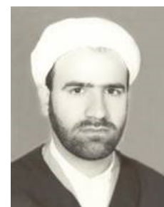
عکس شماره چهار