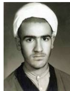
عکس شماره یک