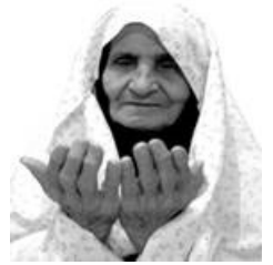
عكس شماره دو