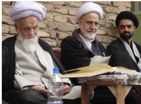
عکس شماره یک